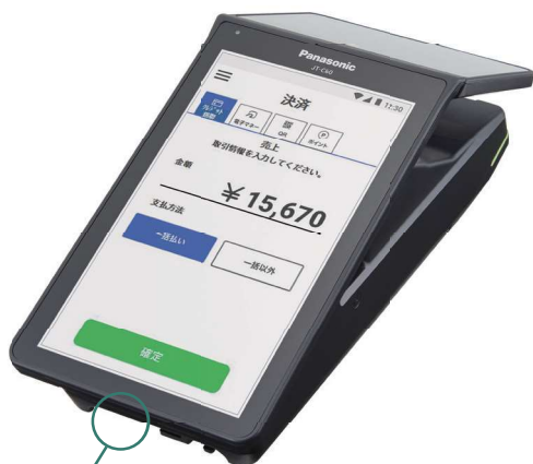
オートカッター付プリンタ