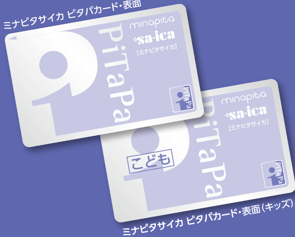
ミナピタサイカ ピタパカード・表面